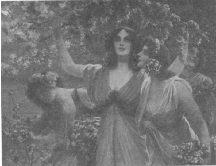
Пощенска картичка, разпространявана във Велико Търново по случай 22 март през 20-те и 30-те години на миналия век

Заслугата за възстановяването на 22 март като местен празник принадлежи на жителите от Асенов квартал. През вече далечната 1970 г. под надслов „Мой любим квартал“ те организират тържество в емблематичната за Велико Търново и България църква „Св. 40 мъченици“. Благородната им идея е подкрепена от обществеността през 1984 година. Оттогава насетне старостоличани продължават традицията, завещана от дедите.