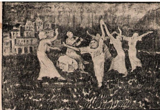
Саръ-Понаръ. Отъ тогава, който минѣлъ ноще около полянката, виждалъ златни палати, предъ които играели самодиви, а въ срѣдата седѣло на мраморенъ камъкъ и свирѣло на кавалъ едно бяло и хубаво момченце.

От тогава, който минел ноще около полянката, виждал златни палати, пред които играели самодиви, а в средата седяло на мраморен камък и свирело на кавал едно бяло и хубаво момченце.